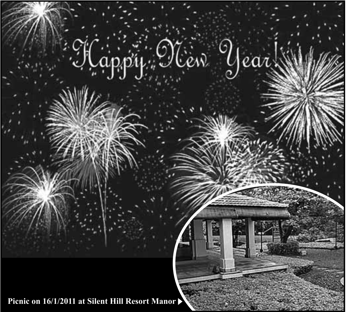
Picnic on 16/1/2011 at Silent Hill Resort Manor ▶