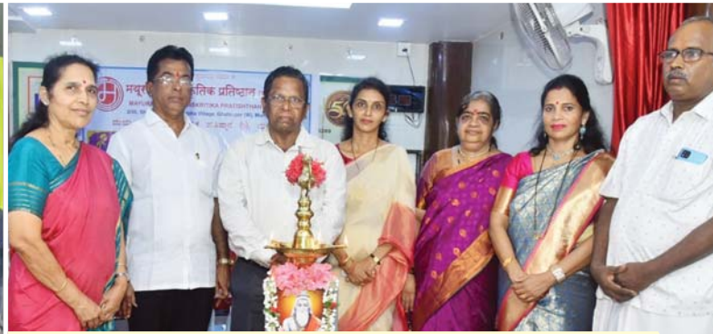
Mayuravarma Sanskritika Prathistana : Vichara Sankirana