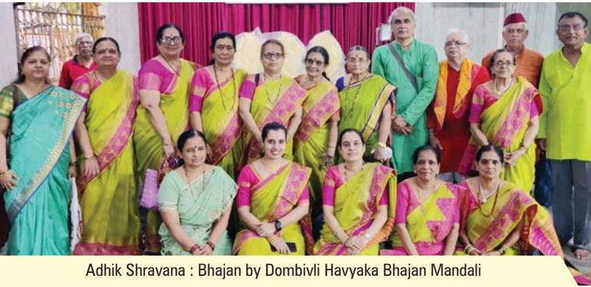
Adhik Shravana : Bhajan by Dombivli Havyaka Bhajan Mandali