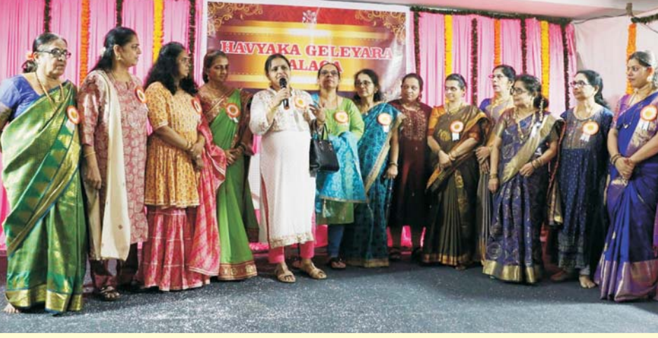
Havyaka Geleyara Balaga Get-together at Mulund