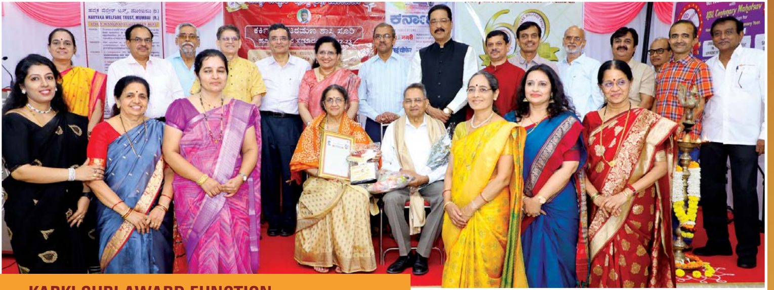
KARKI SURI AWARD FUNCTION