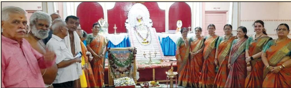
Havyaka Bhajana Mandali at Vittala Mandir, Dombivli (E)